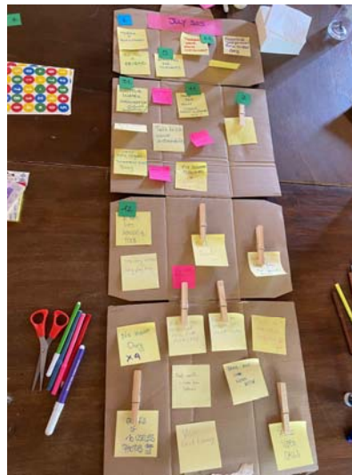
Myndir 1 og 2: Niðurstöður úr Tinkering vinnustofu – Sjálfbærnidagatal. Samstarfshópur verkefnisins – TINK@SCHOOL tók þátt í vinnustofunni í Mílanó á Ítalíu í júní 2023.