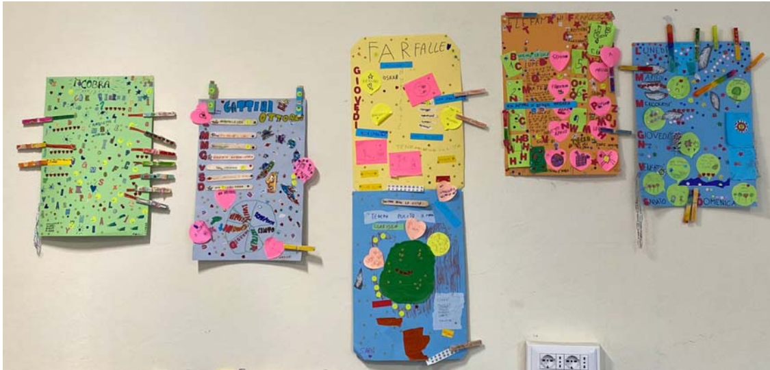
Mynd 3: Niðurstöður frá Tinkering-vinnustofu í Pablo Neruda-skólanum í Róm á Ítalíu.